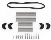
iM20XX-M4-BEZEL Bodenlunette (metrisch)