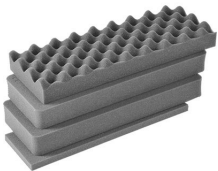
iM2306-FOAM 4 St. Ersatz- Schaumstoffeinsätze