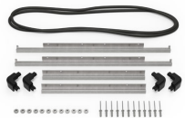
iM2600-M4-BEZEL-L Deckel-Lünette (metrisch)