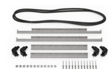
iM2620-M4-BEZEL-L Deckel-Lünette (metrisch)