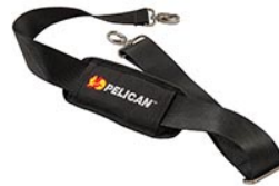
9487 Padded Shoulder Strap