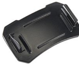
2748 Strapless Headlamp Adapter