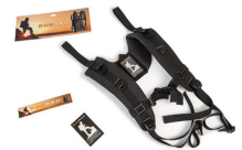
RucPac-normal RucPac Standard Hardcase Rucksack-Konvertierung