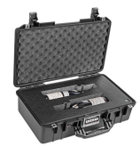
WHISKEY-2B 2 Bottle Whiskey