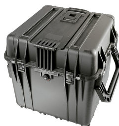
0340NF No Foam