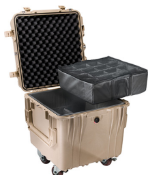
0344 With Padded Dividers