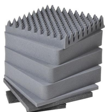
0341 Jeu de mousses de rechange, 7 pièces