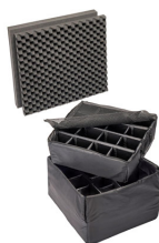
0345 Cloison en mousse