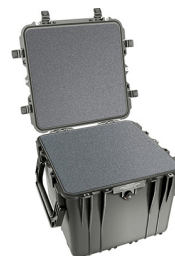
0340WF With Foam