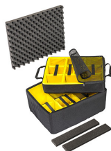
1607AirDS Cloison en mousse