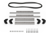
iM2200-M4-BEZEL-L Lunette du couvercle (métrique)