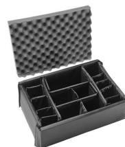
iM2370-DIV Cloison en mousse