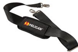
9487 Bandoulière rembourrée