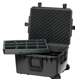
iM2750-X0002 With Padded Dividers