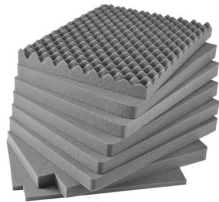
iM2750-FOAM Jeu de mousses de rechange, 8 pièces