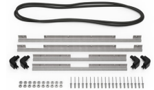
iM2750-M4-BEZEL-L Lunette du couvercle (métrique)