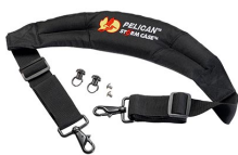
iM-STRAP-S-VER2 Bandoulière rembourrée