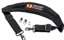
iM-STRAP-S-VER2 Bandoulière rembourrée