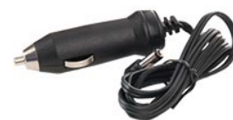
8056F Prise de 12 V pour chargeur rapide