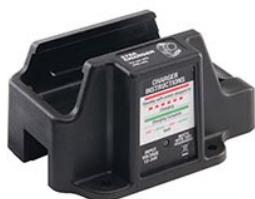
3770F Base de chargeur rapide