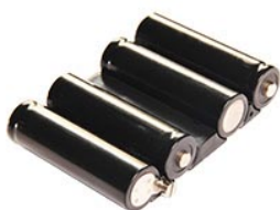
3769 Pile de rechange