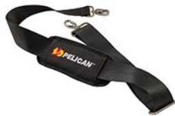
9487 Bandoulière rembourrée