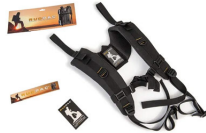
RucPac-normal Conversion sac à dos RucPac standard Hardcase