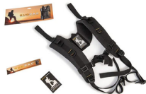
RucPac-normal Conversion sac à dos RucPac standard Hardcase