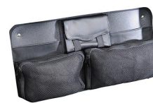
1449 Pochette couvercle Office