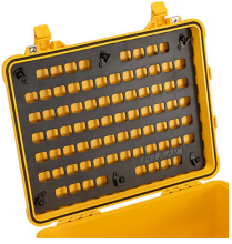
1560MP EZ-Click™ MOLLE Panel