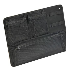
1569 Pochette couvercle