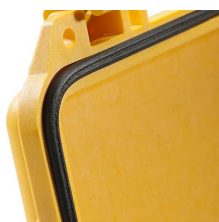
1723 Joint torique de remplaçment