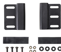
LGMT-001P Fixation pour sur galerie de toit pour valise Peli™ Protector