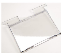
1630DC Accessoire conteneur de documents