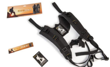
RucPac-normal Conversion sac à dos RucPac standard Hardcase