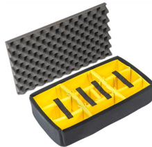
1525AirDS Cloison en mousse