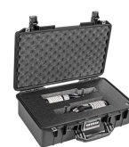
WHISKEY-2B 2 Bottle Whiskey