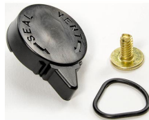
iM-VALVE-M-B Válvula de purga manual