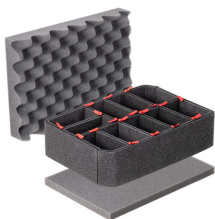
iM2100TPKIT Kit de divisores TrekPak