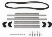
iM2300-BEZEL-LID Marco para instalaciones electrónicas con tapa