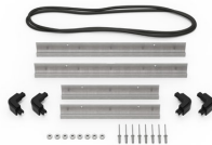
iM2300-BEZEL Kit de bisel para base