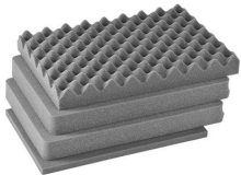
iM2300-FOAM Juego de 4 piezas de espuma de recambio