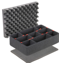
iM2300TPKIT Kit de divisores TrekPak