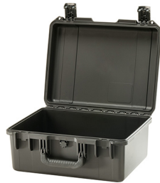
iM2450-X0000 No Foam