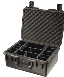
iM2450-X0002 With Padded Dividers