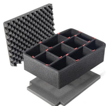
iM2450TPKIT Kit de divisores TrekPak