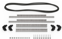
iM2450-BEZEL-LID Marco para instalaciones electrónicas con tapa