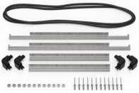
iM2600-BEZEL-LID Marco para instalaciones electrónicas con tapa