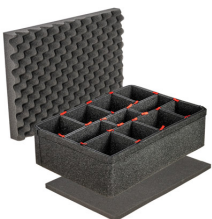
iM2600TPKIT Kit de divisores TrekPak