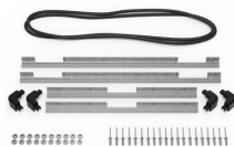
iM2700-BEZEL-LID Marco para instalaciones electrónicas con tapa