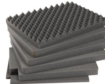
iM2720-FOAM Juego de 6 piezas de espuma de recambio