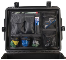
iM27XX-UTILITYORG Organizador de accesorios