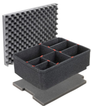
iM2720TPKIT Kit de divisores TrekPak