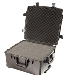
iM2875-X0001 With Foam