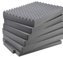
iM3075-FOAM Juego de 7 piezas de espuma de recambio