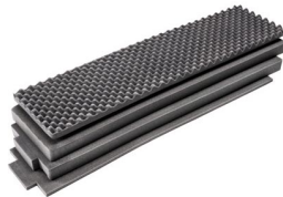
1755AirFS Juego de 4 piezas de espuma de recambio Air Case Soporte de techo para maletas