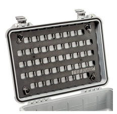
1500MP EZ-Click™ MOLLE Panel