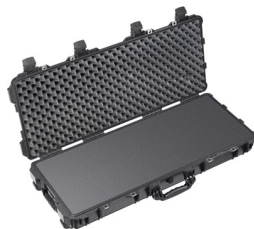
1700WF With Foam