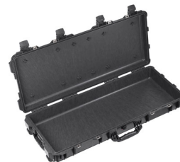
1700NF No Foam