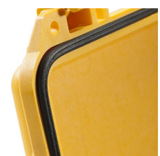
1703 Junta tórica de repuesto