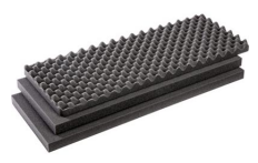
1701FS Juego de 3 piezas de espuma de recambio