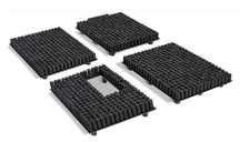
1750PRS RE-SET Kit