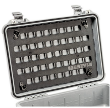
1500MP EZ-Click™ MOLLE Panel