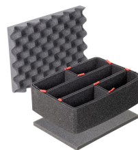
1400TPKIT Kit de divisores TrekPak