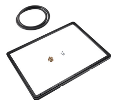
1550PF Panel de adaptación para aplicación especial