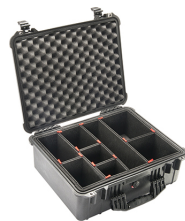
1550TP With TrekPak Divider System