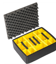
1555 Divisores acolchados