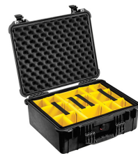
1554 With Padded Dividers