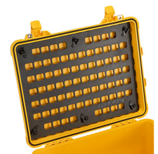
1560MP EZ-Click™ MOLLE Panel