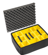
1565 Divisores acolchados