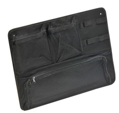
1569 Organizador de tapa