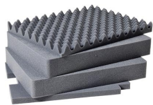
1561 Juego de 4 piezas de espuma de recambio