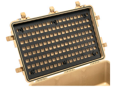
1650MP EZ-Click™ MOLLE Panel