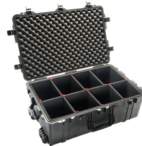
1650TP With TrekPak Divider System