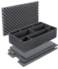
1650TPKIT Kit de divisores TrekPak