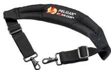
iM2370-STRAP-S Removal Padded Shoulder Strap