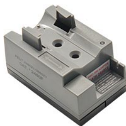
2480F Einrastbare Ladestation