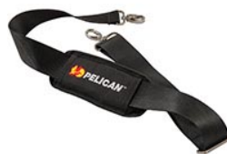
9487 Padded Shoulder Strap