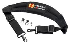
iM-STRAP-S-VER2 Padded Shoulder Strap