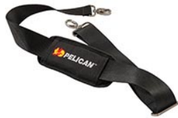
9487 Padded Shoulder Strap