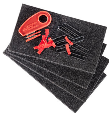
1506TPKIT TrekPak Koffer Teiler Kit