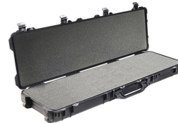
1750WF With Foam