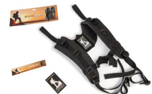
RucPac-normal RucPac Standard Hardcase Rucksack-Konvertierung